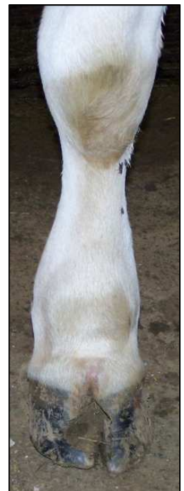
Raideur, boiteries, gonflement