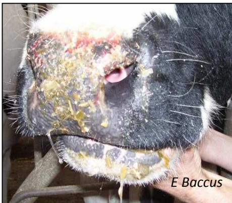
Nez croûteux et sale