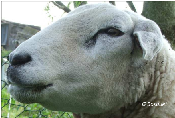
Cœdème, tête enflée