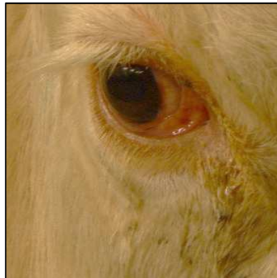
Yeux rouges et larmoyants