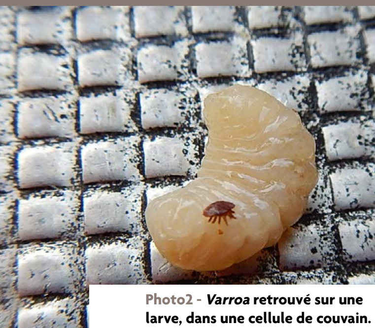
Photo2 - Varroa retrouvé sur une larve, dans une cellule de couvain.

Ainsi, pour chaque cycle de reproduction, chaque femelle engendre 2 à 3 femelles adultes fécondées dans le couvain de faux-bourdon et 0,8 à 1,5 femelles filles adultes dans le couvain d'ouvrière.